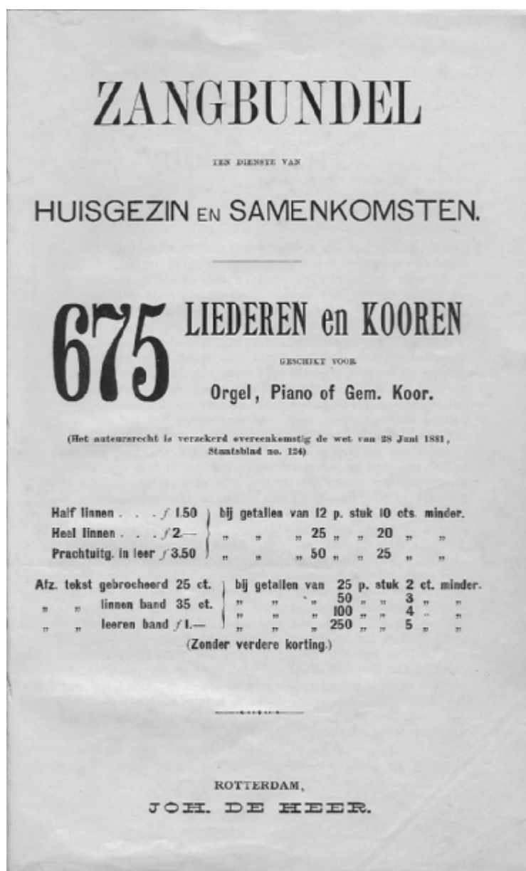
Titelblad van de eerste druk van de Zangbundel.