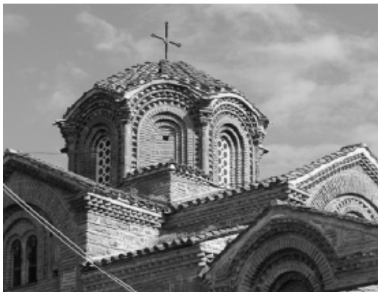
De koepel van de Sv. Bogorodica Perivlepta in Ohrid van de buitenkant

Hoe moet je tegen die uitspraak aankijken? Het gevaar is dat je de hele latere verering van Maria er al in gaat lezen, tot en met de dogma's van de roomse kerk dat Maria onbevlekt ontvangen is en ten hemel gevaren. Maar in feite was van dat alles nog geen sprake in 431. De discussie ging niet over de Mariaverering, maar over de wijze waarop je tegen Christus aan moest kijken, dus om de christologie. Nestorius benadrukte de echtheid van Christus' mensheid en het onderscheid tussen mensheid en godheid in Christus. Zijn tegenstanders legden de nadruk op de eenheid van Christus: Hij die uit Maria geboren is, is niemand anders dan het eeuwige goddelijke Woord, van wie we toch (in Nicea) beleden hebben dat Hij Zelf God is, één van wezen met de Vader. Efeze 431 weerlegt ook vanuit de christologie de wijze waarop Nestorius het Theotokos belache-