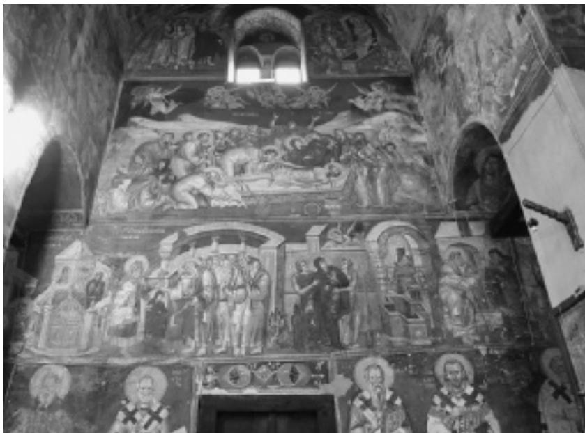
Fresco's aan de binnenkant van de koepel van de Sv. Bogorodica Perivlepta. Onderaan taferelen uit het leven van Maria, daarboven de graflegging van de Here Jezus, helemaal boven een heiligengeschiedenis.

lijk heeft gemaakt. Het gaat er niet om, zo stelt het concilie, dat het goddelijk Woord naar zijn eigen natuur of naar zijn godheid zijn oorsprong in Maria genomen zou hebben. Maar de menselijke natuur van Christus, die uit Maria stamt, vormt een persoonlijke eenheid met zijn godheid. Daarom kan gezegd worden dat Maria God gebaard heeft.