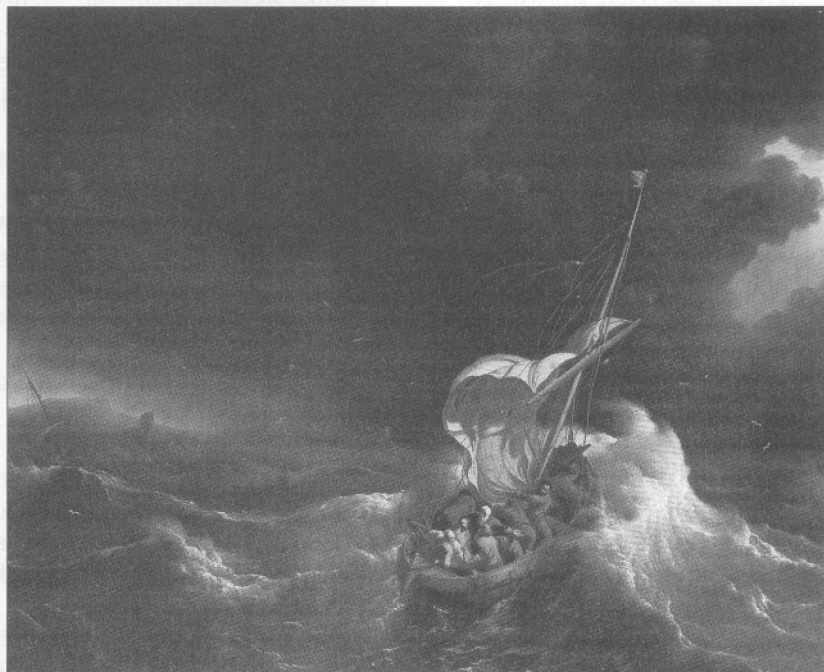
Afb 2: Ludolt Backhuysen, Christus slaapt tijdens de storm op het meer van Galilea , Minneapolis Institute of Arts, Minneapolis. Op de tentoonstelling komt dit thema drie maal voor.

WL. Meijer is parttime docent Kunst- en Cultuurgeschiedenis aan de Gereformeerde hogeschool te Zwolle en auteur van verschillende publicaties op dat gebied