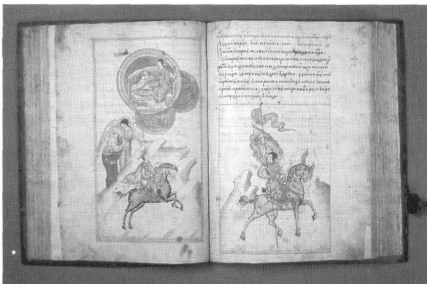
Openbaring 6 1-4 miniatuur op papier 36,5x26,5 cm