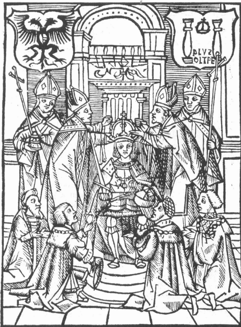
Kroning van Karel V tot keizer in Aken op 23 oktober 1520. Houtsnede uit 'Le Triumphe du couronnement.' (Antwerpen 1520).

ters. En of het nog niet genoeg is, bestrijdt hij ook de zeven heilige sacramenten: hij laat er maar twee, sommigen zeggen drie van over! Intussen leert deze Luther niet alleen zijn studenten, maar pleegt hij ook in de kerkdiensten allerlei gewaagde uitspraken te doen, die de gelovigen het idee geven dat ze zich vrijer dan ooit kunnen opstellen tegen de heilige moederkerk. En dan heeft het land te maken met die permanente stroom van boeken en pamfletten die de man uit Wittenberg laat verspreiden! De beweging van deze ketter begint steeds populairder te worden en kan wel eens uitlopen op een ware revolutie. Ieder weet hoe de