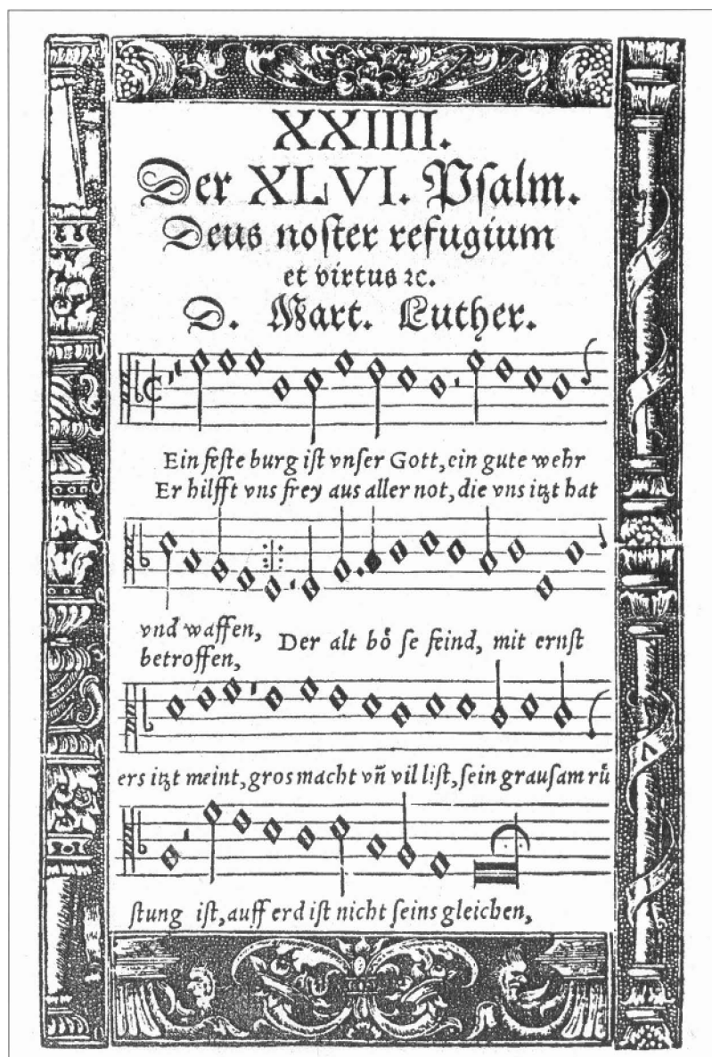
Psalm 46. Een vaste burcht is onze God (Facsimile uit 16e-eeuws Gezangenboek)

Schrift, het levende Woord van God. En wat het concilie betreft, elke bijeenkomst waar het Woord van God het alleen te zeggen heeft, is een concilie. De schoolmeester is een concilie als hij de leer van Christus handhaaft in zijn domein! Een 'echt' concilie is alleen gebonden aan Gods Woord.