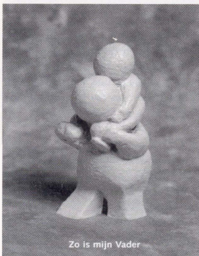
© Merweboek Sliedrecht Ontwerp: Harry van de Geer

Denk aan Psalm 103:5 (berijmd): Zoals een vader liefdevol zijn armen slaat om zijn kind, zo is God