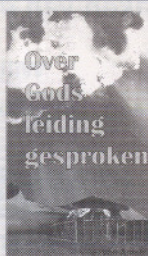
Ook verkrijgbaar bij de boekhandel

Denk goed na over de vraag die de overheid u binnenkort voorlegt. Maak er een gebedszaak van. Overleg met uw huisgenoten of naaste familieleden of vrienden. Zeg niet lichtvaardig "ja", maar maakt u zich er evenmin gemakkelijk van af door een snel "neen". Indien u positief beslist, kunt u enkele voorwaarden (m.n. hersenendoodcriterium) aangeven of vermelden welke organen u eventueel beschikbaar wilt stellen.