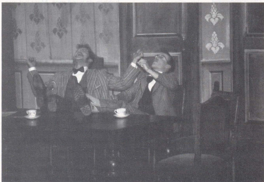
een al lang ingeburgerde kunstvorm in de buitenschoolse activiteiten van gereformeerde scholen

Gereformeerd kunstonderwijs kan zich dus in alle christelijke vrijheid richten op de door de overheid gevraagde brede culturele en kunstzinnige vorming. Het uit de taboesfeer halen van film, toneel en dans draagt niet alleen bij aan het recht doen aan de vele talenten die christelijke jongelui, als beelddraggers van God, gekregen hebben. Het onderwijs in deze vakgebieden zal ook zijn positieve uitstraling hebben naar een artistieke wereld, waar met Gods geboden geen rekening wordt gehouden. Niet in de laatste plaats zijn deze vakken van groot belang voor het op artistieke en daarmee indringende wijze vormgeven van een christelijke visie op mens en wereld, ook op terreinen van cultuur en media als televisie en bij het uitdragen van christelijke normen en waarden in de samenleving.