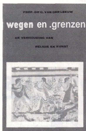
omslag van 'Wegen en grenzen', de derde druk uit 1955.

Hij had een uitgesproken mening over de vervlakking, het gebrek aan eigen stijl en de standaardisering van de Nederlandse cultuur. Al in 1932 verscheen een eerste versie van 'Wegen en grenzen'. Met de