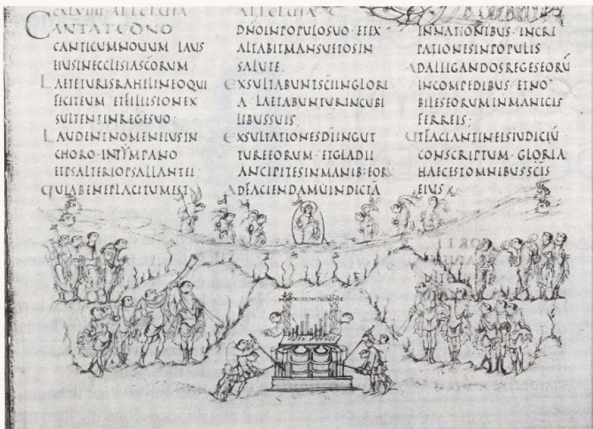
Tekst van Psalm 149 en de illustratie bij Psalm 150

spanning een orgel aan de gang proberen te houden, dat door twee man tegelijk bespeeld wordt: 'looft Hem met de fluit'.