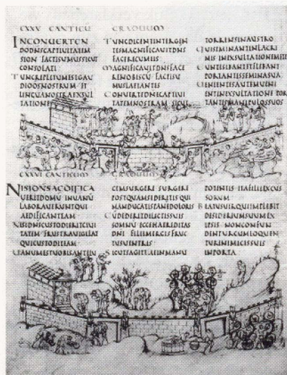
Tekst van Psalm 126 en 127 en de illustraties bij Psalm 127 en 128, samen op een bladzijde

in Nederlanders komt het in de 17e eeuw hier op een veiling terecht. Een Utrechtse eigenaar schenkt het uiteindelijk aan de plaatselijke universiteit. Op de tentoonstelling in Utrecht ligt het boek open bij de eerste bladzijden met daarop de tekenin-