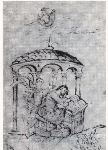
Psalm 1: de gelukzalige man

gen uit het leven van Christus, voor zover dat overeen kwam met het profetische karakter van de psalmen. Andere illustraties hadden het leven van koning David, als dichter van het boek, tot onderwerp. Bijzonder bij het Utrechtse Psalter is, dat de tekeningen betrekking hebben op & letterlijke tekst. Psalm 1 bijvoorbeeld begint met de beken- & 'man die aan des HEREN wet zijn welgevallen heeft, en diens