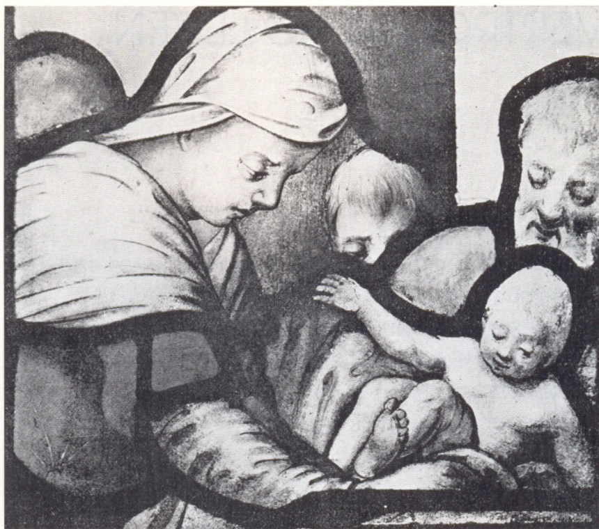
Lambert van Noort: 'Maria en Jozef tonen het Kind in de tempel' (detail); glas-in-lood, Oude Kerk, Amsterdam.

Prediker zet de deur op een kier. In de nacht van de geboorte zet het engelenleger de deur wijd open. Zonneklaar geeft God zijn geheim prijs in het geschenk van Jezus Christus,