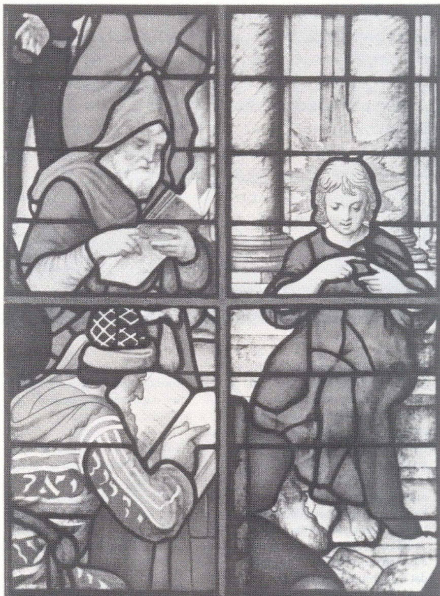
Lambert van Noort: fragment van 'de 12-jarige Jezus tussen de schriftgeleerden'; glas-in-lood, St. Janskerk, Gouda.

Als Hij zegt : Ik ben het licht der wereld en Hij zegt : U bent het licht der wereld, dan belooft Hij erg veel. Genoeg voor ons om mee voor de dag te komen.