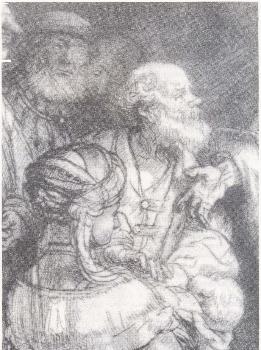
Rembrandt: detail uit de Honderdguldenprent; Petrus duwt met zijn hand de boby en zijn moeder weg, Christus' hand nodigt moeder en kind uit en wijst tegelijk Petrus terug. (een exemplaar van de eerste staat in het Rijksprentenkabinet, Rijksmuseum, Amsterdam).

Met name een grote ets (28 bij 39 cm) van Rembrandt, de Honderdguldenprent, speelt een belangrijke rol in Meijers studie. Stuk voor stuk bespreekt hij de vorm die Rembrandt aan de figuren gegeven heeft en welke betekenis ze daardoor krijgen. Opvallend is bijvoorbeeld de uitbeelding van de Here Jezus. Hij is de enige figuur die in zijn geheel frontaal is weergegeven en valt alleen al daardoor extra op. Hij is een hoofd groter dan de omstanders en trekt door zijn indringende gelaatsuitdrukking en zijn handgebaren alle aandacht naar zich toe. Rechts knielen twee figuren in eerbiedige aanbidding neer. Ze behoren tot een groep zieken, lammen en blinden die van die kant op de Here aantrekken. Achter hen aan volgt een groep die kennelijk 'van verre' gekomen is om de Heiland te ontmoeten. Iemand klimt van een kameel, een ezel doet zich te goed aan een baal stro en rechts vooraan ontwaren we zelfs iemand van het zwarte ras. Links voor komt een moeder met haar kind op Jezus af. Petrus kijkt de Here vragend, bijna bestraffend aan en wil met zijn hand de vrouw afweren. Maar Christus duwt met zijn gebaar de apostel terug en no-