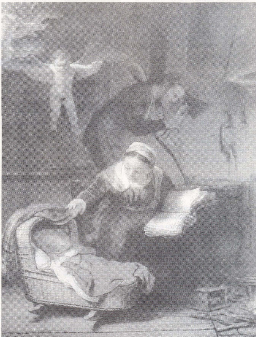
Rembrandt: De heilige familie met de engelen, 1645. Hermitage, St. Petersburg. (Dit schilderij hangt tot 13 april a.s. in de Nieuwe Kerk in Amsterdam op een tentoonstelling over tsarina Catharina de Grote).

Om vast te stellen of iemand gereformeerd is, vraag je naar zijn kerkelijke papieren. Een doopbewijs, een attestatie geven daarover uitsluitel. Voor personen die reeds lang overleden zijn, raadpleeg je de nog bewaard gebleven archiefstukken van kerkelijke gemeenten. Door allerlei oorzaken kunnen daar hiaten in zijn ontstaan. Hoe ouder het archief, hoe meer er ontbreekt. Ook voor Rembrandt van Rijn (1606-1669) gaat dat op. Zijn eigen doopbewijs ontbreekt, en zijn inschrijving als belijdend lid van een gereformeerde kerk hebben we niet. Uit geen enkel document is dus met volledige zekerheid af te leiden dat hij gereformeerd was. Hij trouwt wel in die kerk, maar dat zegt niets. Iedereen, gereformeerd of niet, trouwde zo, want een burgerlijke stand kende men