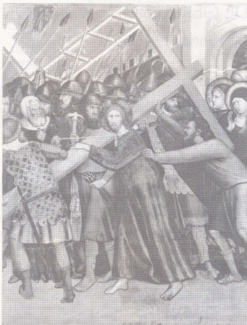
Barna: kruisdraging. Fresco in de Collegiata-kerk van San Gimignano. Circa 1360 schilderde de kunstenaar Barna, waarover niet veel bekend is, deze kruisdraging op de wand van de kapittelkerk in San Gimignano, Italië.

Niet alleen de keus van het middelste kruis, ook het aanbrengen van een drietalig opschrift boven Jezus' hoofd (Mt. 27,37), komt van Pilatus zelf. Alleen de evangelist Johannes benoemt het opschrift met de Romeinse term titulus , hier vergriekt tot titlos . Het opschrift op het middelste kruis functioneert dus als boventiteling bij het tafereel op Golgota. Ziehier de koning der joden, door Romeinen gekruisigd! Soms moest de veroordeelde op weg naar de plaats van executie een bordje dragen met daarop de beschuldiging. Misschien fungeerde zo'n bordje ook als publieke waarschuwing tijdens het voltrekken van de straf. Dit hoorde echter niet bij de officiële procedure. Terwijl alle evangeliën melding maken van het feit dat de gekruisigde op deze manier werd betiteld als de koning der joden, geeft Johannes als enige de volledige tekst van de kruistitel. Daaruit blijkt dat Jezus door Pilatus nader werd omschreven als 'de Nazoreeër': een denigrerende bijnaam die herinnert aan zijn afkomst uit Nazaret in Ga-