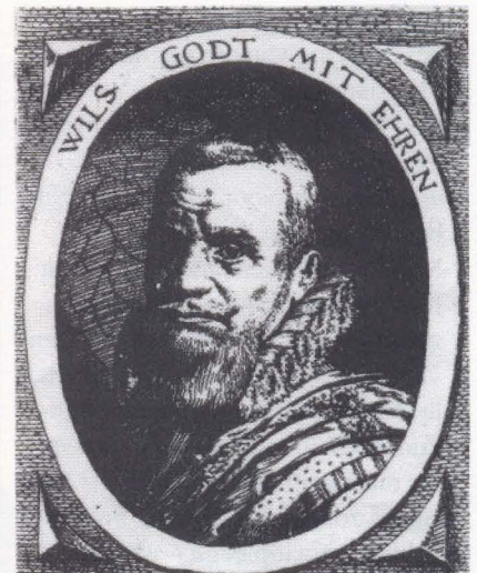
Anonieme prent van Willem Lodewijk (1621), afgedrukt in Emmius' biografie

magnificus en hoogleraar geschiedenis en Grieks aan de in 1614 gestichte Groningse universiteit. Mede door zijn intensieve contacten met Groningse ballingen in Oost-Friesland was Emmius in Groningen in deze functies benoemd. En daarin had stadhouder Willem Lodewijk uiteraard een beslissende stem. Op zijn beurt heeft Ubbo Emmius er ook weer veel voor ondernomen om Franciscus Gomarus in Groningen benoemd te krijgen. Zowel de stadhouder als deze beide geleerden waren overtuigde tegenstanders van Arminius en de Remonstranten.