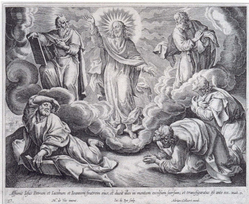
Maarten de Vos: De verheerlijking op de berg (ca. 1620). kopergravure, 18 bij 22 cm. Bijbels Openluchtmuseum, Heilig Landstichting.

de christelijke kunst vanaf de middeleeuwen tot het eind van de 18e eeuw is dat steeds zichtbaar ge-maakt door twee werelden weer te geven, de aardse en de hemelse, gescheiden door bijvoorbeeld wolken of een verschil in grootte of kleur van de uitgebeelde personen en objecten. Op de tentoonstelling 'de verbeelding van God' zijn daar voorbeelden van te zien. Ten twee-