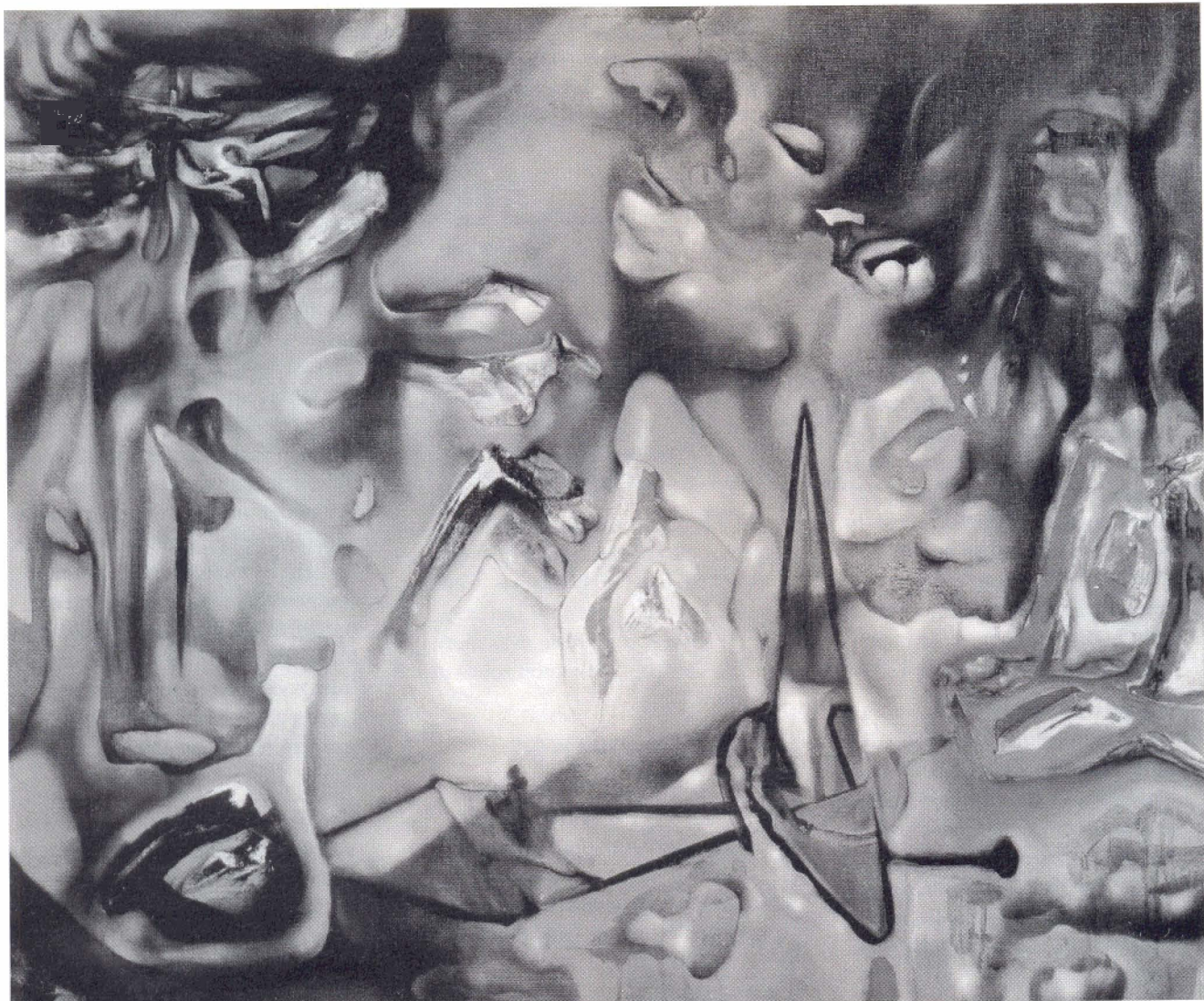
Roberto Matta: Inscape (1939). Olieverf op doek, 73 bij 93 cm. Museum voor moderne kunst, San Francisco.

de moderne kunst. Ze wijst op de invloed van de franse dichter Apollinaire op Picasso en het Cubisme en van de russische filosoof Ouspensky op het surrealisme. Zowel Apollinaire als Ouspensky waren zeer betrokken bij het denken over de oneindigheid in deze wereld en het bestaan van de vierde dimensie. Ze inspireerden zich daarbij onder andere op de theosofische geschriften van mevrouw Blavatsky of de 'hyperspace'-filosofie van Charles Howard Hinton, die in 1904 een boek schreef onder de titel 'De vierde dimensie'. Een voorbeeld van zo'n modern godsbeeld, of mensbeeld want dat maakt niets meer uit als je god in jezelf zoekt, is het schilderij 'In-