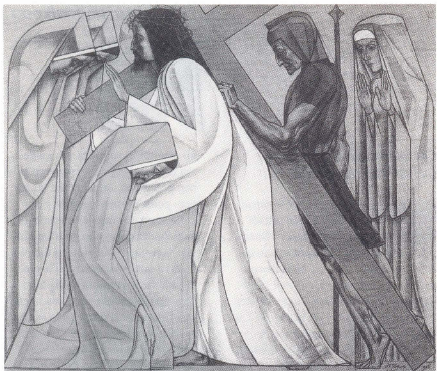
Toorop: Kruiswegstatie nr. 8.

dit schilderij een enigszins opdringerig affiche-zonder-tekst . Het heeft er even de schijn van alsof, tegen alle moderne kunst in, de dagelijkse realiteit weer genoeg zinnol is om verbeeld te worden. De vraag blijft echter wat Scholte ons wil vertellen over die zichtbare werkelijkheid . De clown maakt namelijk een cartoon, waarop een gezapige kunstenaar, dikke buik vooruit, achter een ezel staat waarop Edvard Munch's beroemde werk 'de schreeuw'. Daarmee wordt iets van de betekenis van dit doek van Scholte duidelijk. 'De schreeuw' geldt als een symbool voor de in de moderne wereld van alle relaties losgeraakte mens die het in doodsnood uitschreeuwt, zo sterk dat de