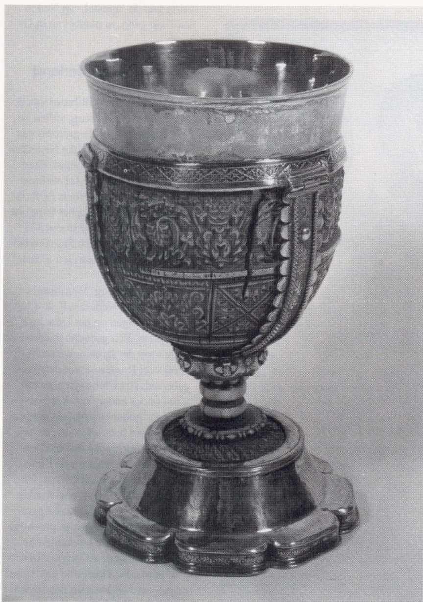
Lebuinuskelk, ca. 800. Ivoeren kelk met acanthus-motief dat teruggaat op een Romeins voorbeeld, gevat in deels verguld zilver.

met een gravure van het Lam en een kalkstenen beeldje met daarop een tronende Christus. Van deze laatste twee is het trouwens de vraag of ze in Friesland zelf vervaardigd zijn.