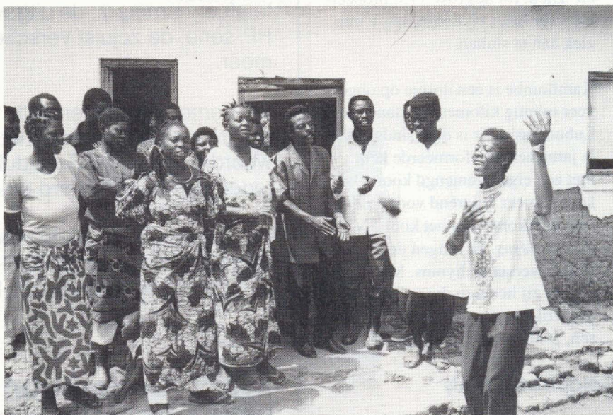
Hef kerkkoor van de Eglise Réformée Confessante au Zaïre in Kamilombe

Ook in de gereformeerde kerken in Zaïre speelt muziek een grote rol in de diensten. Vrijwel elke gemeente heeft op z'n minst één kerkkoor en een ritmesectie voor de begeleiding van de gemeentezang. Wat tekst betreft zijn het vaak lofliederen, maar ook oproepen tot bekering. Ook zijn er liederen waarin een bijbelverhaal wordt verteld. Bijvoorbeeld de bekering van Paulus, gevolgd door een oproep tot beke-