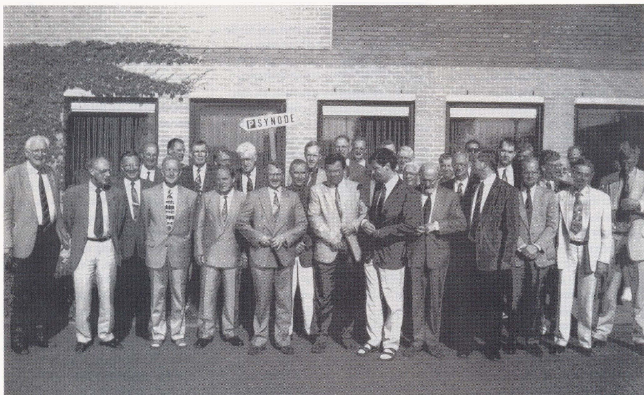
De synode knoopt haar jasje dicht

in de kerken over de liturgie was gehouden. De respons was niet erg groot. Maar inhoudelijk leverde het wel wat op. De studiegroep was vervolgens zelf het verleden ingedoken. De bronnen van onze liturgie heeft ze aangeboord. En met wat ze verzameld had kwam ze naar de actualiteit. Concrete suggesties deed de groep over vernieuwing van de liturgie. Daarbij maakten ze gebruik van eeuwenoude ervaring.