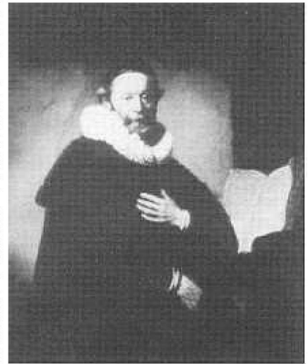
2. Rembrandt: Johannes Wtenbogaert. Olieverf op doek, 1633.