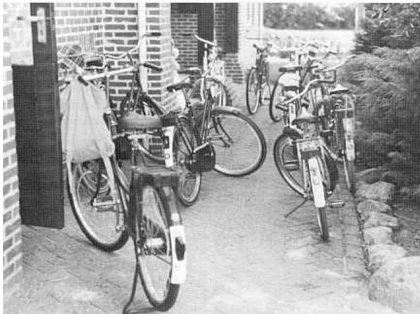
De fiets... het voertuig van pubers bij uitstek.

Pubers worden zich meer van zichzelf bewust. Kinderen die in de puberteit zijn denken na over zichzelf. Het anders zijn treedt meer op de voorgrond dan tijdens de kinder -periode. De kans bestaat dat deze pubers en hun leeftijdgenoten steeds verder uit elkaar groeien. Vereenzaming kan het gevolg zijn en minderwaardigheidsgevoelens steken de kop op. Het is niet gemakkelijk voor de ouders om dit te begeleiden. Zij hebben daarbij ook hun eigen zorgen en verdriet daarover. Gelukkig is het vaak mogelijk ervaringen te delen met lotgenoten en (praktische) hulp te vragen bij gespecialiseerde organisaties.