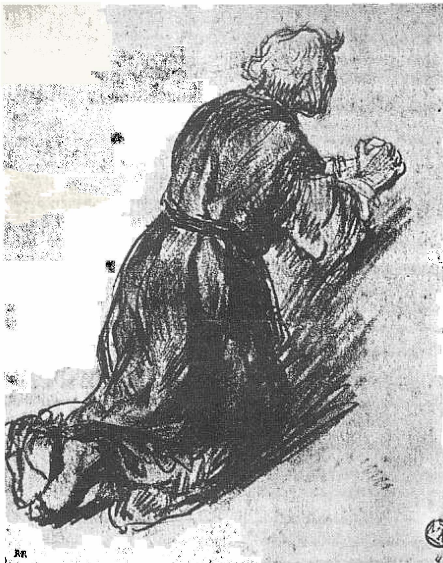
Uit 'Grootmeesters van de kunst Rembrandt een selectie uit zijn tekeningen'. Uit: Ridderhof; Rotterdam 1979.

Voor het moderne levensgevoel zijn er dan weinig problemen: wanneer je je best hebt gedaan en het 'lukt niet, dan ga je uit elkaar. Bij voorkeur op een wat volwassen manier, zodat je elkaar niet onnodig kwetst. Moderne hulpverleners zeggen: Je moet immers je leven invullen zoals bij je past, zodat je tot je recht kunt komen. Moderne filosofen zeggen: Anderen buiten jouzelf kunnen geen oordeel uitspreken over de wijze waarop je je leven moet/wilt/kunt invullen. Ook de juistheid of onjuistheid van je motieven kunnen en mogen anderen niet beoordelen. Belangrijk is dat je in evenwicht bent met jezelf. Gelovige mensen kennen Gods gebod. Gelovige mensen willen Gods