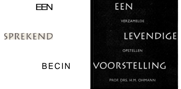
Omslagen van 'Een sprekend begin' en 'Een levendige voorstelling'.