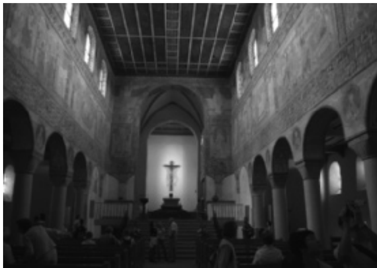
St. Georg, Reichenau-Oberzell (eind 9 e eeuw): interieur met wandschilderingen van de wonderen van Jezus.

De in Reichenau vervaardigde perikopenboeken werden verlucht met illustraties (de zogeheten miniaturen ) die bij de evangeliefragmenten (perikopen) pasten. Voor het eerst in de geschiedenis van de beeldende kunst van West-Europa verschenen er miniaturen in deze boeken die aan de hand van de liturgische bijbelteksten het leven van Christus uitbeeldden. Op dit soort reeksen moet de decoratie van de St. Georg in Reichenau-Oberzell gebaseerd zijn.