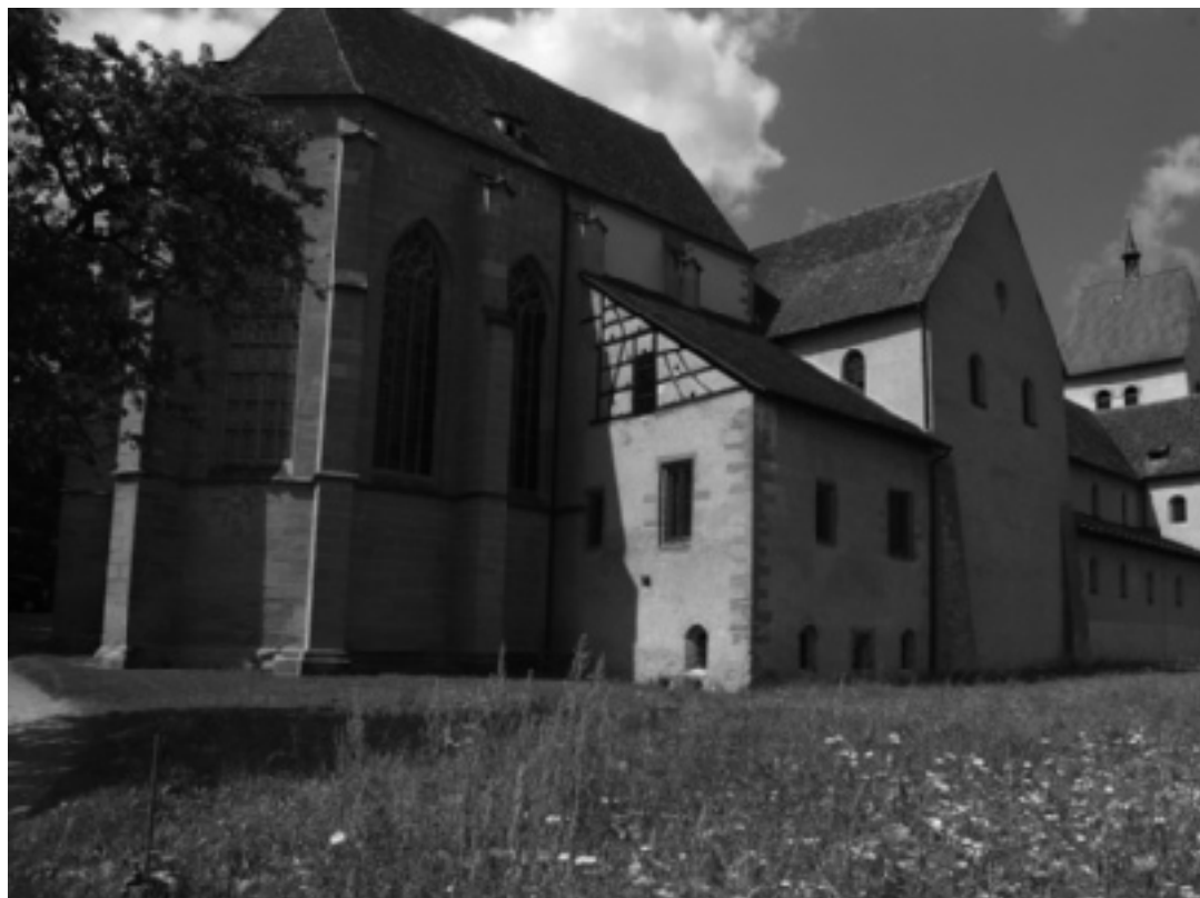
Abdijkerk St. Maria en Markus, Reichenau-Mittelzell.