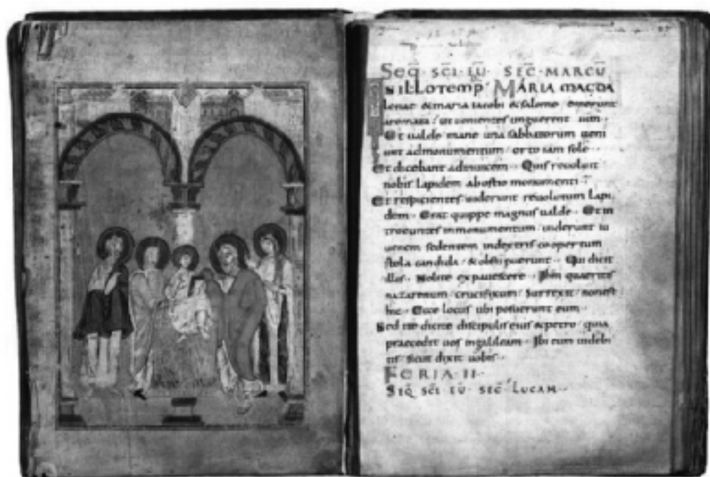
Twee bladzijden uit een perikopenboek (Reichenau, eind 10 e eeuw).

ken momenten uit het leven van Jezus weergeven. Ze inspireerden zich daarbij op vroegchristelijke en byzantijnse voorbeelden die ze in Rome en Venetië hadden gezien of waarvan exemplaren in hun scriptorium terecht waren gekomen.