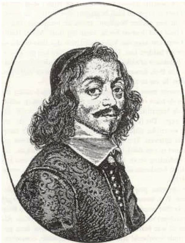
Constantijn Huygens (1648)

tweede welke disciplines autoriteit hebben om bij de exegese de doorslag te geven. In het eerste vraagstuk stelt Van Velthuysen dat bij de uitleg van de tekst gezocht moet worden naar wat de Heilige Geest in de tekst ons