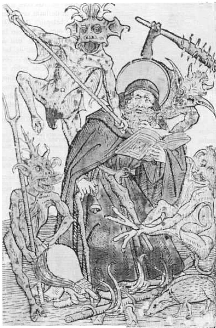
1. De verzoeking van de heilige Antonius Abt (ca. 1490); houtsnede, 23 x 16 cm. Luik, Universiteitsbibliotheek

Op een houtsnede uit ca. 1490 staat hij afgebeeld, rustig studierend en nadenkend met het boek in de hand, terwijl hij door vier duivels met tweetanden en knotsen belaagd wordt. Eén ervan staat met een blaasbalg het vuurtje onder de heilige (als verwijzing naar het Sintantoniusvuur) aan te wakkeren. De vier duivels zijn overigens zelf danig aangetast door de ziekte, gezien de vele rode vlekken op hun lichamen ( afb.1 ).