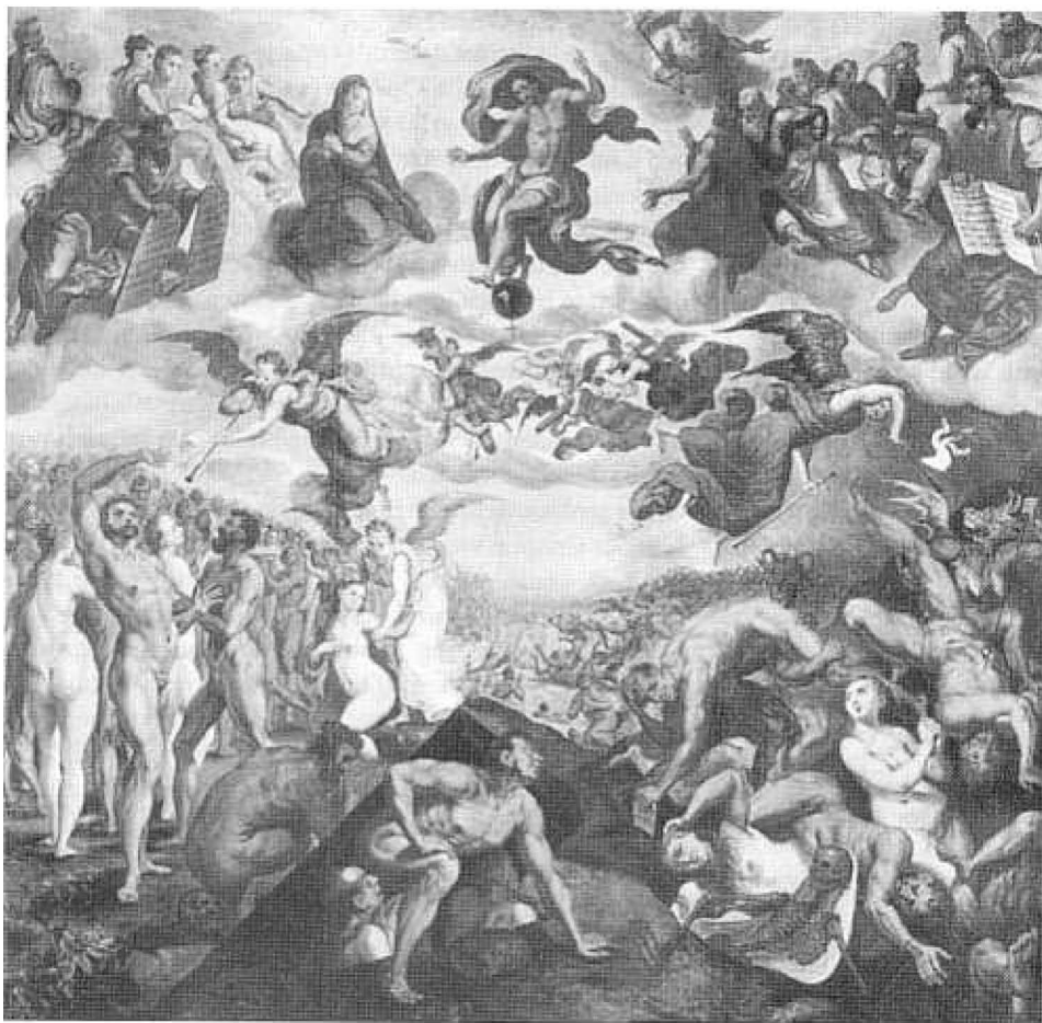
2. Crispijn van den Broeck, Het laatste oordeel (ca. 1570); olieverf op paneel, 90 x 88 cm. Utrecht, Het Catharijneconvent.

geschriften van kerkvaders) of over het optreden van duivels en demonen in laat-middeleeuwse Nederlandse kunstwerken als 'Mariken van Nieumeghen' en de schilderijen 'De verzoeking van de heilige Antonius' en 'Het Laatste Oordeel' van Jeroen Bosch. In het werk van deze beroemde Brabantse kunstenaar is ook de invloed merkbaar van de laatmiddeleeuwse heksenleer.