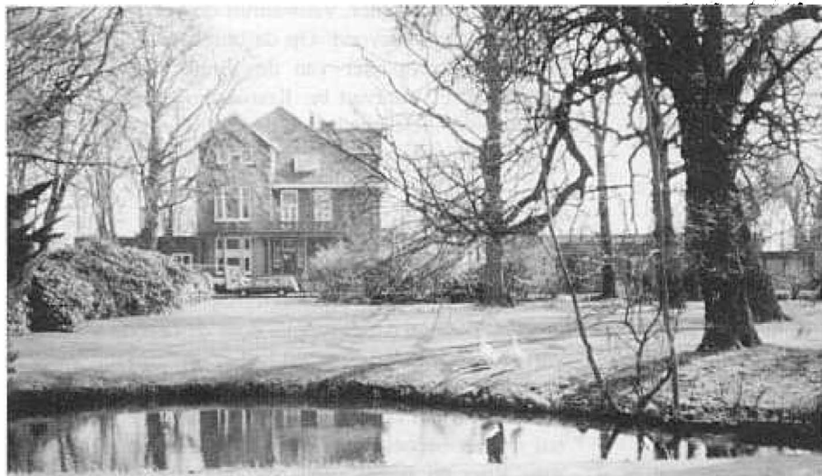
Huize Vliet en Burgh aan het Oosteinde te Voorburg (thans is er een kindertehuis van het Leger des Heils in gevestigd).

rij'. In de zitting van 23 maart 1944 werd de Kamper hoogleraar voor drie maanden geschorst. Deze uitspraak leidde weer tot een stroom van brieven van kerken en kerkle- den uit het gehele land naar de synode. Men vroeg zonder uitzondering de schorsing van Schilder op te heffen. Op 26 juli werd prof. dr. S. Greijdanus geschorst, terwijl op 3 augustus de synode zover ging om Schilder af te zetten.