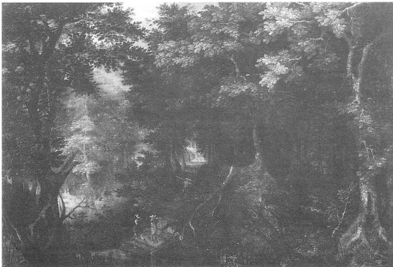
Gillis van Coninxloo, jagen in een bosgezicht (1605).

Kunsthistorici zijn het erover eens, dat zich aan het begin van de 17e eeuw radicale veranderingen voltrokken in de uitbeelding van het Nederlandse landschap. Men pleegt deze veranderingen aan te duiden met de term 'realisme',