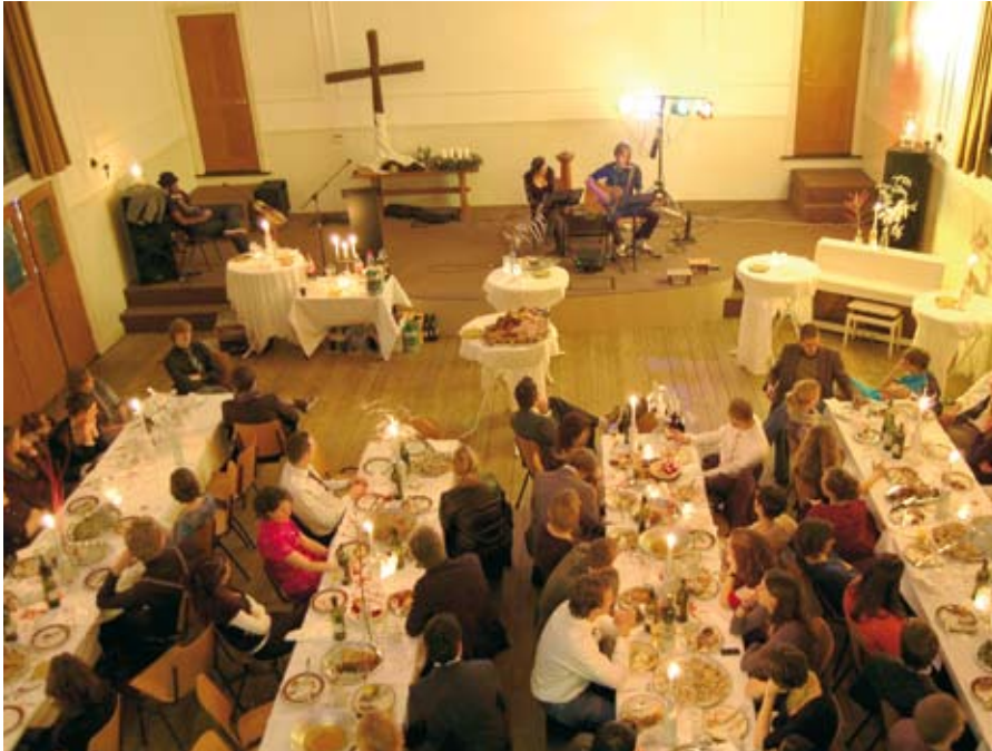
Kerstviering in Stroom , Amsterdam

werd dit bevestigd. Hij krijgt regelmatig vragen van geïnteresseerde buitenstaanders. 'Wat geloven jullie nu eigenlijk? Waar staan jullie voor?' Natuurlijk zou hij kunnen verwijzen naar de visie zoals die in een aantal documenten op hun website staat, of naar de geloofsbelijdenissen waaraan voorgangers in de GKv gebonden zijn. Een dergelijk beroep op buitenkant zou echter gemakkelijk ook afstandelijk kunnen werken. Hoe nuttig het ook kan zijn om deze zaken