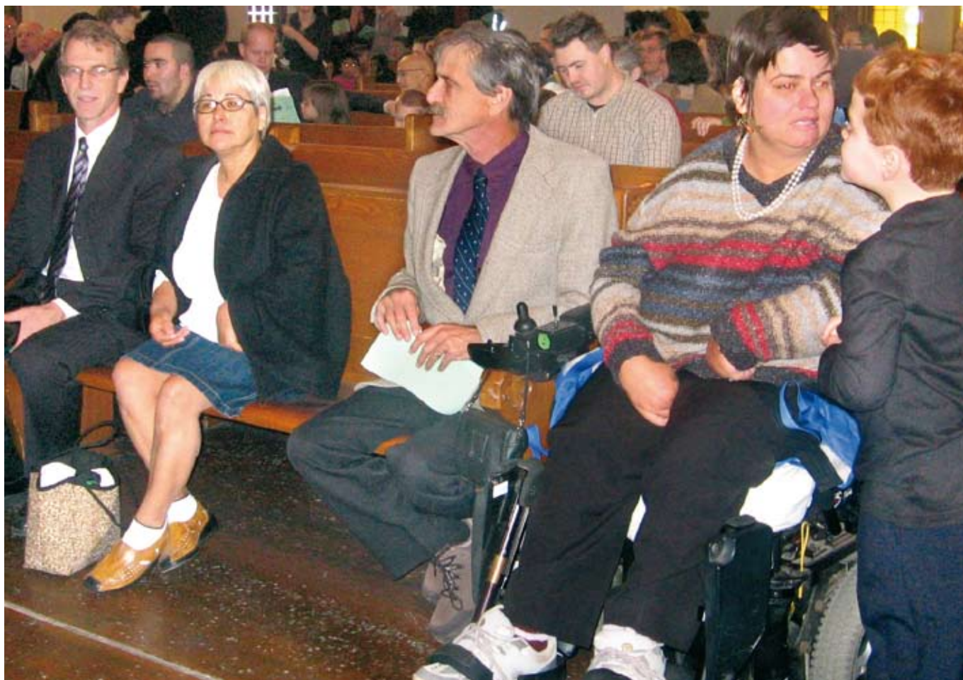
Een samenkomst in Streetlight ///

Voor meer informatie, zie: www.ancasterchurch.on.ca/streetlight/index.html