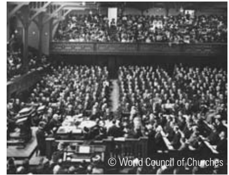
De wereldzendingsconferentie van 1910 in Edinburgh

Wereldchristendom Het waren dus niet alleen de seculiere en politieke krachten die zich tegen de westerse superioriteit keerden. Juist de beschuldigingen vanuit de niet-westerse kerken waren niet van de lucht. De zendelingen hadden een westerse kerk gesticht, met belijdenissen die westerse problemen bespraken, met westerse orde, eredienst, structuur en organisatie. Het hele christendom moest opnieuw vorm krijgen, maar nu binnen de kaders van de niet-westerse landen, culturen