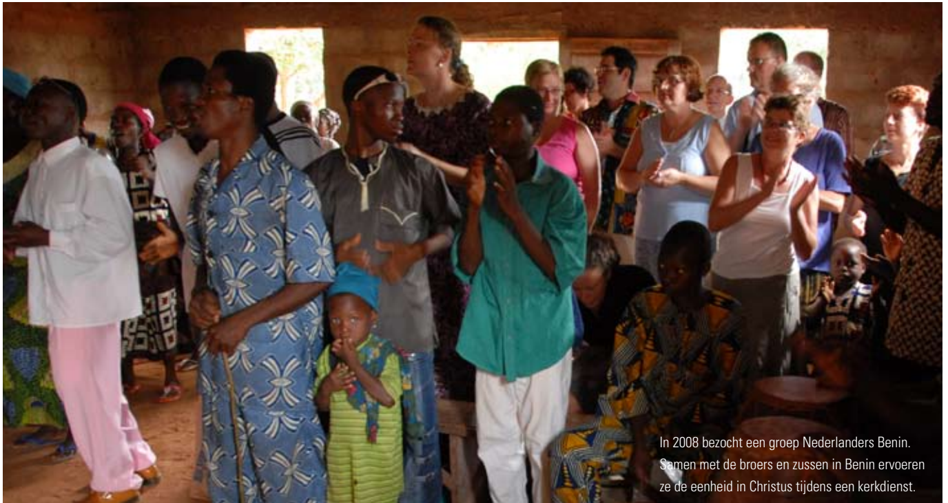
In 2008 bezocht een groep Nederlanders Benin. Samen met de broers en zussen in Benin ervoeren ze de eenheid in Christus tijdens een kerkdienst.