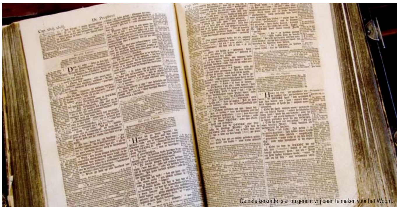
De hele kerkorde is er op gericht vrij baan te maken voor het Woord.

tegen het vrouwenstandpunt van de SGP. Tekenend voor de huidige stemming lijkt me een ingezonden in het Nederlands Dagblad naar aanleiding van een recente uitspraak van de Hoge Raad in deze zaak. De inzender meende dat het alleen nog een kwestie tijd is voordat het komt tot officiële veroordeling van de beperking van het kerkelijke kiesrecht tot de mannenbroeders. Met het van staatswege erkende gelijkheidsbeginsel in zijn gangbare ruime uitleg lijkt de rechter een instrument in handen gedrukt te krijgen om niet-staatelijke verbanden open te breken. Zal de verruiming van het passieve kiesrecht niet worden afgedwongen? Is onze toezichthoudende buurman niet met een breekijzer gewapend? Ik vermoed dat deze vrees breed onder de kerkmensen leeft.