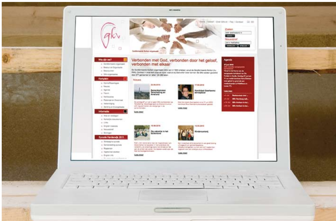
De website van de gereformeerde kerken (vrijgemaakt) biedt naast een schat aan praktische en toegankelijke informatie over kerken en organisaties ook uitleg over gereformeerd en over vrijgemaakt zijn, en over de belijdenissen. Zie www.gkv.nl .

mogelijkheden om je als kerkelijke gemeente te presenteren. Onderschat niet hoeveel mensen je via bijvoorbeeld blogs, YouTube, Twitter of Hyves kunt bereiken. Ik heb al heel wat tweets over inspirerende preken zien langskomen. Via sociale netwerken (Hyves, Facebook, LinkedIn) kun je heel snel informatie uitwisselen. We moeten ons er tegelijk wel van bewust zijn dat al deze media-mogelijkheden van weinig betekenis zijn wanneer je zelf nauwelijks iets te bieden hebt. Je kunt wel heel wat investeren in je presentatie naar buiten toe via de nieuwe media, maar dat blijft altijd van secundaire betekenis. Willen we als christenen aantrekkelijke missionaire gemeenschappen vormen, dan zullen we vooral moeten investe-