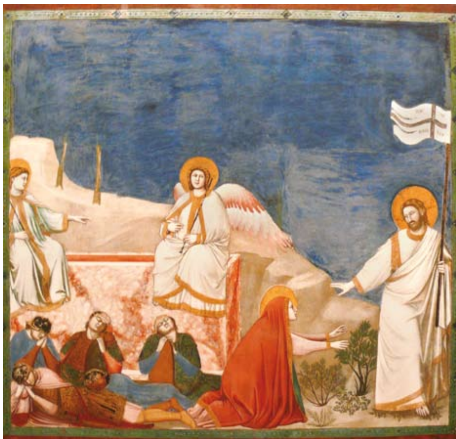
De opstanding , geschilderd door Giotto di Bondone (ca. 1266 – 1337). Deze afbeelding staat op het omslag van het boekje waarin dit artikel is verschenen.

Schilder – maar evengoed over Kuitert, Wiersinga of Schillebeeckx. Onder al die gesprekken echter, hebben ze mij die diepe overtuiging meegegeven dat ik voor wat écht belangrijk is telkens naar de Bijbel toe moet.