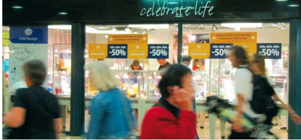
Het leven draait om de mens en niet om God: de aloude boodschap van de duivel ///

Radicaler Zeker, de kerk en kerkleden worden bedreigd door allerlei culturele ontwikkelingen waardoor zij los van God komt te staan en zichzelf in het middelpunt plaatsen. Daarom hameren voorgangers en profetische kerkleden in hun kritiek op het tegenovergestelde: God en Zijn eer centraal. 3 Dat is mijns inziens echter even onvruchtbaar als mensmiddenpuntig preken. Laat ik uitleggen wat ik daarmee bedoel. Het kernprobleem