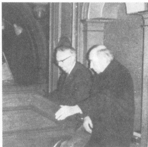
Hendrik Andriessen (l) en Albert de Klerk achter de speeltafel van het Adema-orgel te Haarlem (foto uit 1978)

Wanneer ik De Klerks uitvoering in één woord zou moeten typeren, dan zou dat het woord 'piëteitsvol' zijn, in de meest positieve betekenis. Andriessen schreef eens: 'Een