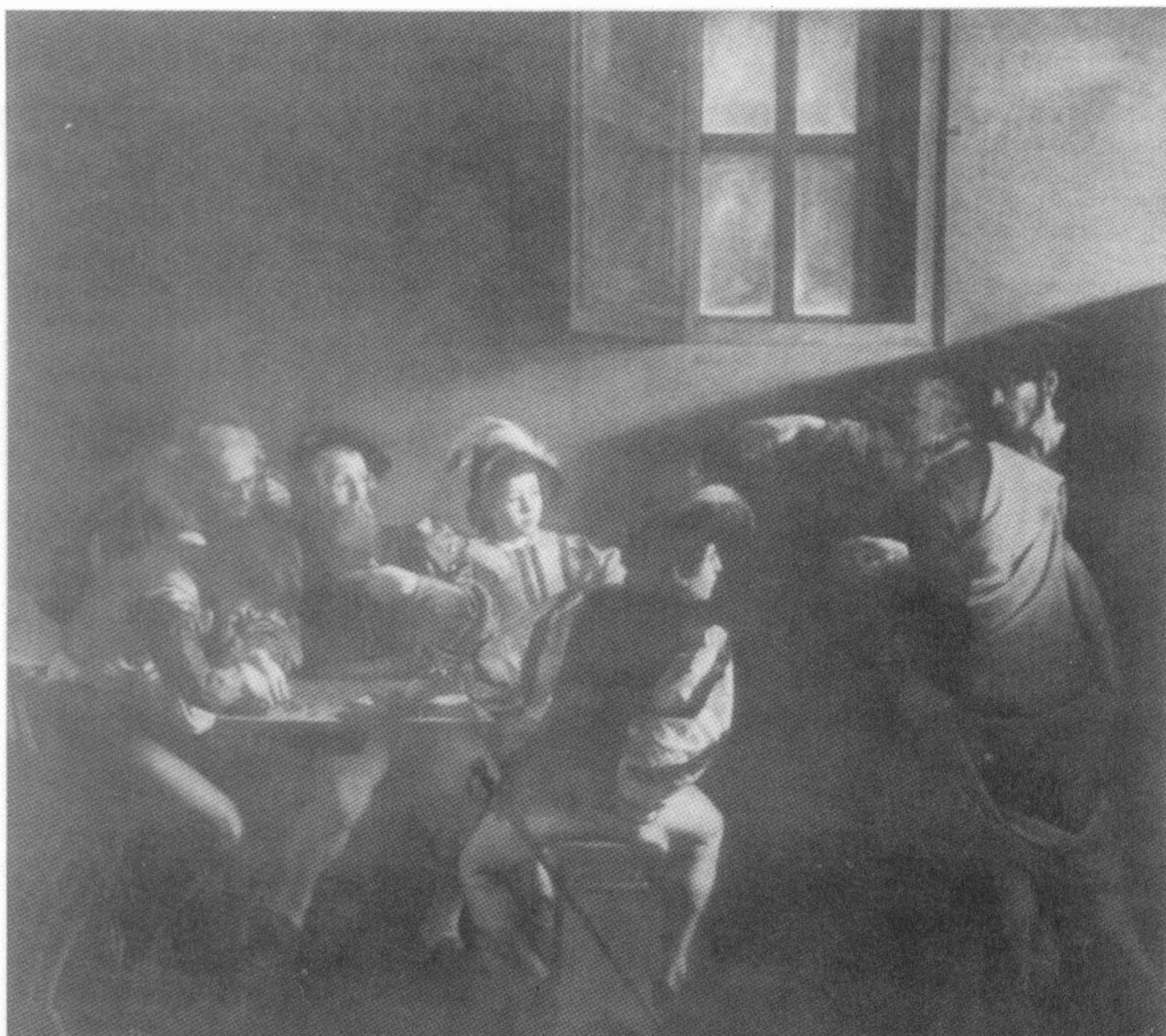
Roeping van Mattheus (3,2 x 3,4 m).

gen de buitenmuur van een niet nader aangeduid huis (het tolhuis), alleen herkenbaar aan de raamopening inet daarin een kozijn mei vier ruitjes en het openstaande luik. Evenwijdig aan de wand staat een tafeltje inet een groep figuren daar omheen. De twee linkse, een oude man en een jonge knul zijn vol aandacht voor het geldtellen (er liggen zes munten op tafel). In het midden zit Mattheus de tollenaar, met z'n rechterhand nog bezig een geldstuk op tafel te leggen. Maar verder is zijn aandacht al getrokken door wat er rechts gebeurt. De twee jongens met de geveerde mutsen hebben alleen nog maar oog voor de verschijning van de twee mannen rechts. De rugfiguur met het zwaard buigt zelfs al verbaasd in hun richting. Je ziet ze denken: wat is dat nou? Mattheus hoort zich aangesproken worden. Ook hij begrijpt de zaak nog niet helemaal. Aarzelend lijkt zijn linkerhand omhoog te komen en we zijn geneigd dit te lezen als een vraag: Wie nou, zij of ik? Maar volgens Mattheus' eigen beschrijving werd hij onmiddellijk bekeerd toen Jezus zei: 'Volg mij!' Het