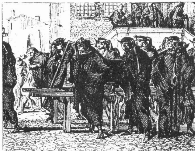
Het was de gewoonte de kist open door de stad te dragen, met goed zichtbare, rijk versierde overledene. In pesttijden werd dit gebruik aan bonden gelegd.

In dit artikel wil ik de visie die Van Beverwijck in zijn pamflet voor vakgenoten uit de doeken doet nader bezien. Daarna wil ik ingaan op de resultaten van een enquête die Van Beverwijck in 1634 gehouden heeft bij vooraanstaande geleerden van zijn tijd. De antwoorden op die enquête geven een duidelijk beeld van de opstelling van o.a. contra-remonstranten in de bovengenoemde discussie.