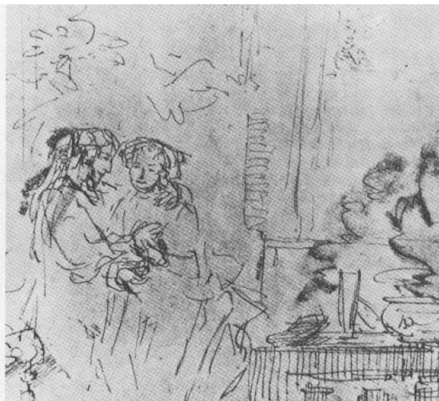
Afb. 2. Schets door Rembrandt naar prent (afb. 1)

In de derde plaats attendeert het feit van deze ontlening ons op het willekeurige van de gangbare titel. We hebben niet te maken met zo maar een stel. Rembrandts figuurstuk houdt verband met het genre van de historieschildering.