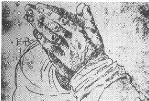
Bidden of je hart niet bitter wordt Het gebed, Hans Baldung Grien (1454-1545).

Wel zes keer klinkt in Joh 3 als een noodkreet 'Waarom?'. Hij roept God ter verantwoording. Forceert Hem tot een antwoord. Zingend lied verstomt.