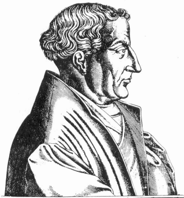
Martin Bucer (1491-1551)

In dit gedenkjaar wordt er nationaal en internationaal aandacht aan de figuur van Bucer gegeven. Ook wij willen aan deze belangrijke reformator niet voorbijgaan.