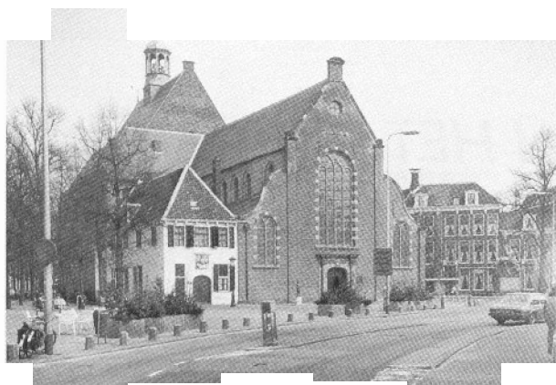
Afb. 3: Janskerk, voorgevel

inscriptie (hier uit het Latijn vertaald): 'Voor het kruis des Heren hier, moge de bende van de boze vijand op de vlucht slaan/mogen daarom (ook) voor u Koenraad alle tegenstanders wijken'. De betekenis van deze tekst zal duidelijk zijn: Dit kruis dient als relikhouder voor een splinter van het kruis van Christus. Omdat Christus bij zijn dood aan het kruis en de daarop volgende opstanding de dood en de zonde overwonnen heeft, heeft deze splinter een sterke afwerende kracht. Duivelen en vijanden, de geestelijke en wereldlijke tegenstanders van de keizer, zullen bij het zien van dit kruis verschrikt terugdeinzen. Vandaar ook dat keizer Koenraad in het uur van zijn dood juist deze relikhouder vlak bij zich wilde hebben.