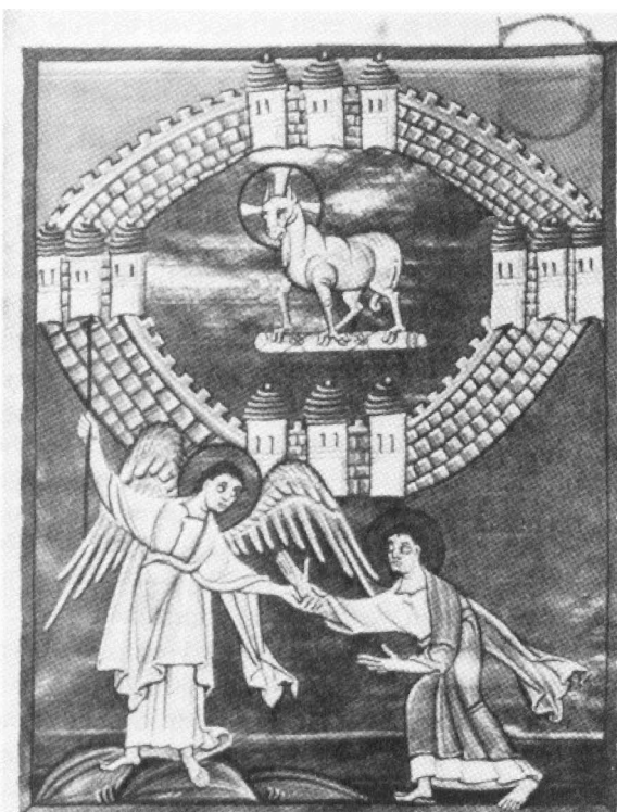
Afb. 5: Miniatuur uit de Bambergse Apocalyps, 1e kwart 16 eeuw.

Nog een ander punt van vormgeving onderstreept deze betekenis. Vanaf de Mariakerk liep de processieweg naar de kathedraal. Langs deze rechte weg – nog altijd zichtbaar in de huidige stadsplattegrond – trok de keizer vanaf zijn paleiskerk naar de Dom voor de feestelijke kroning, bedoeld als de bevestiging van zijn macht, of voor het bijwonen van de feestliturgie op een kerkelijke hoogtijdag.