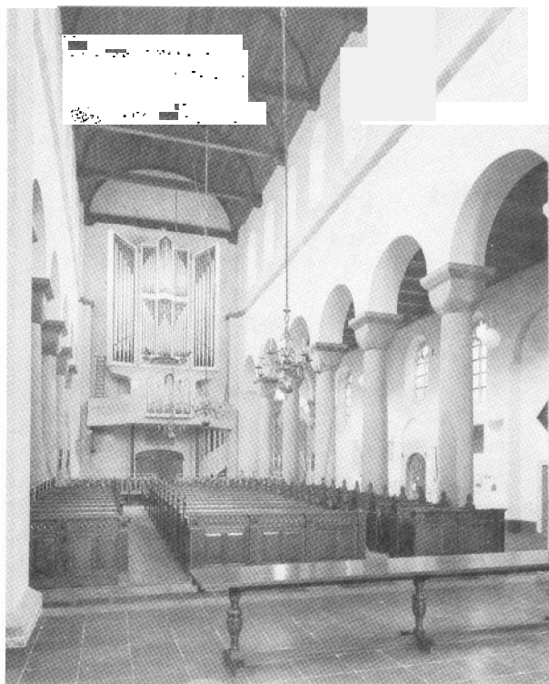
Afb. 4: Pieterskerk, schip

De vierde kerk, de ten westen van de Dom gelegen Mariakerk, werd wel door keizer Hendrik III gepland, maar pas gerealiseerd onder Hendrik IV tegen het jaar 1099.