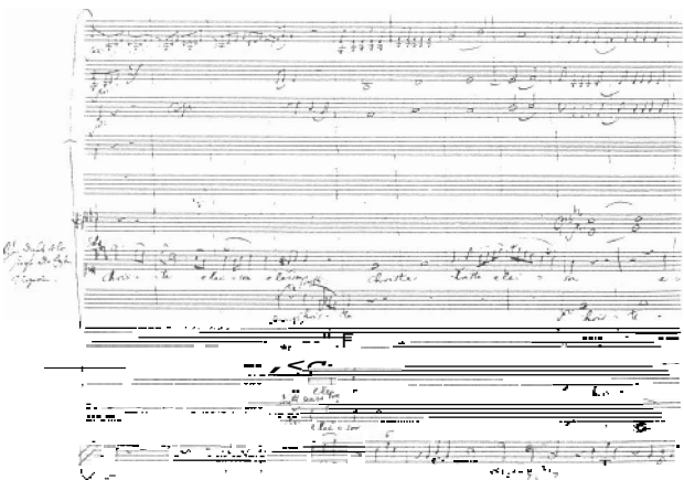
Gedeelte uit Mis in c , KV 427, in Mozarts handschrift

Een ander gevolg was dat Mozart in zijn composities korte motieven ging gebruiken. Wanneer je een kort thema hebt, heb je ook minder tijd nodig om in een compositie het thema uit te werken. Ook was het terwille van de tijd niet langer mogelijk in de kerkmuziek gebruik te maken van solistische stukken, zoals opera-achtige aria's. We zien dan ook dat Mozart zich beperkte tot het 'hoogst-noodzakelijke'. Ook uitgebreide fugatische gedeelten voor koor, die traditioneel gebruikt werden in o.a. het Gloria en Credo, moesten er op een gegeven moment aan geloven. Het kostte allemaal teveel tijd.