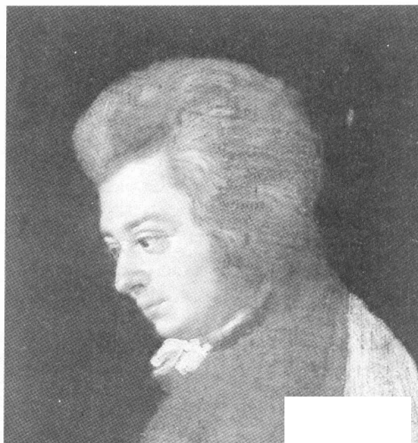
Wolfgang Amadeus Mozart (schilderij van Joseph Lange, Y 1789)

Een heet hangijzer waai ook dat de tekst dikwijls overheerst werd door de muziek. Componisten maakten de ingewikkeldste composities. Razend knap , maar hopeloos voor de verstaanbaarheid van de tekst. Dikwijls werden diverse tekstregels tegelijkertijd gezongen. Dat kwam de