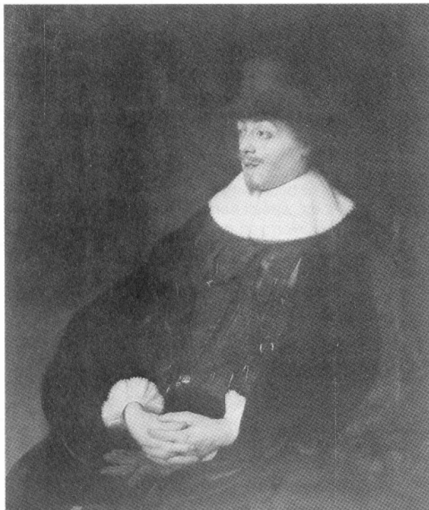
Jan Lievens, portret van Constantijn Huygens, 1628-29.

Huygens (1596-1687) staat bekend als wellicht de grootste calvinistische dichter uit het 17e-eeuwse Holland. Hij was een zeer geleerd man, kende z'n talen (waaronder