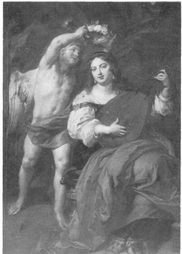
Theodoor van Thulden, Allegorie op het huwelijk, ca. 1652.