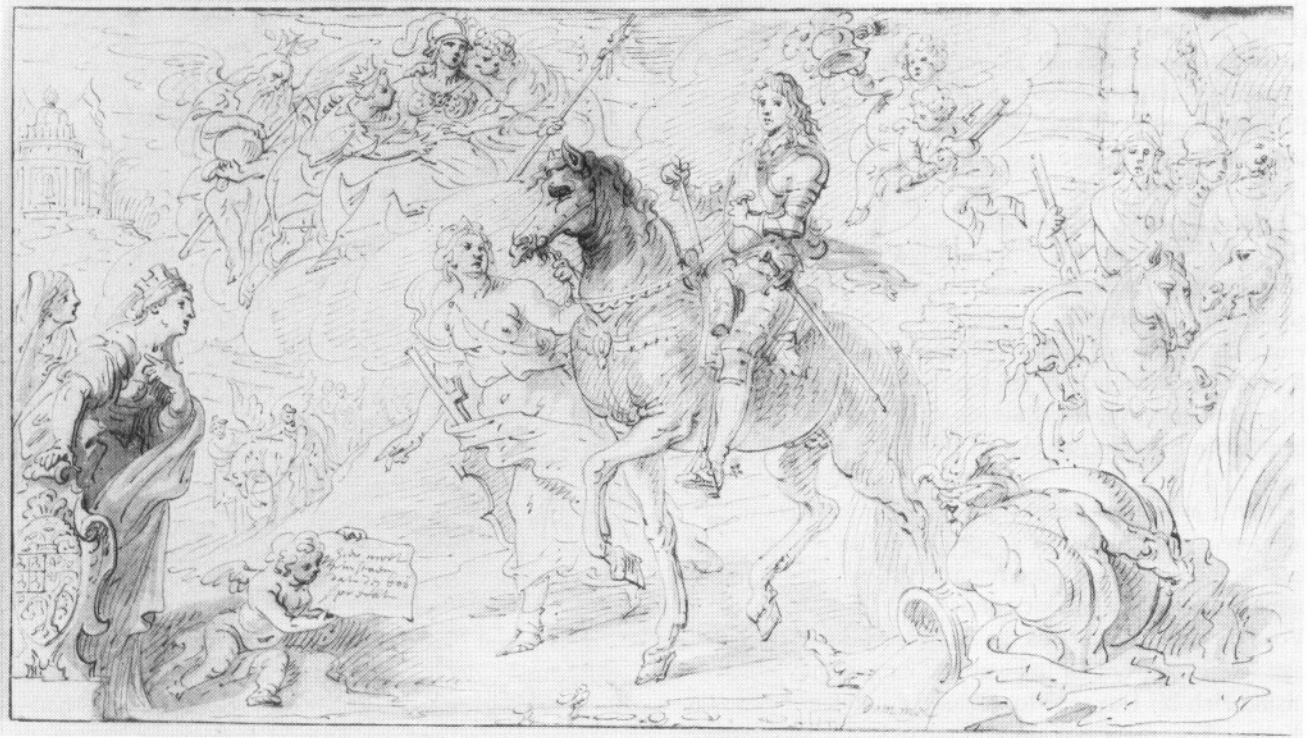
Theodoor van Thulden, Allegorie op Den Bosch en prins Willem III , ca. 1666.

Het is opvallend hoe een figuur als Theodoor van Thulden, een leeftijdgenoot van Rembrandt, hier naar voren