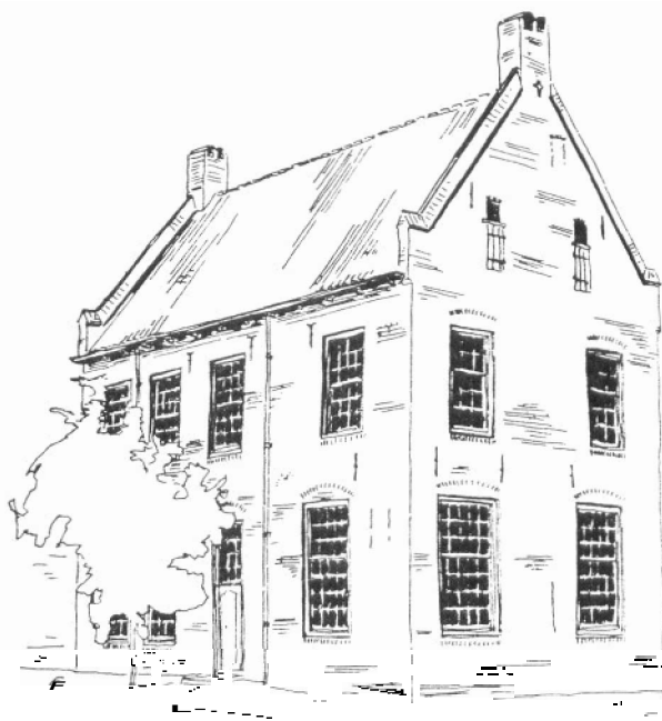
Fraterhuis aan de Paardenmarkt te Doesburg, plaats waar de gemeente samenkomt

Omdat er naast het ambtelijke werk en de verplichtingen