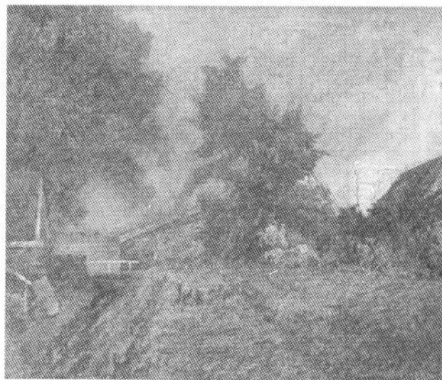
landschap, 1893, olieverf (65 x 75 cm); (privéverzameling).