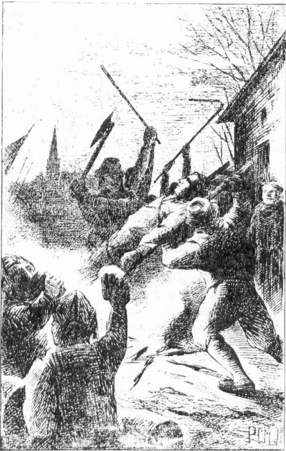
Illustratie (L 1,5 x 14 cm) 'Dood van Hendrik van Zutphen' voor 'Medeërfgenamen van Christus', uitgegeven door Höveker & Zoon, Amsterdam 1894 (Haags Gemeentemuseum)

Mondriaan in het heil calvinisme toen nog niet geheel ver broken was (afb. 1).