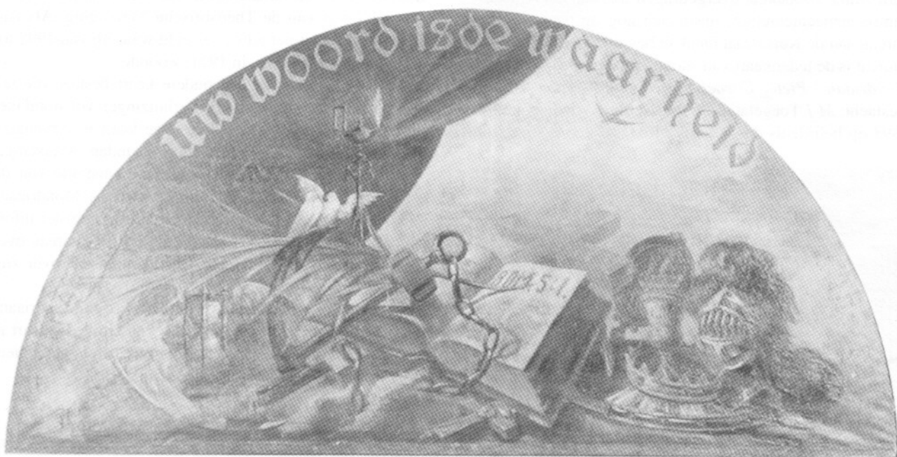
Allegorie 'Uw Woord is de Waarheid', ca. 1893/4. 150 x 250 cm. Particuliere collectie, Winterswijk.

Wat het vroege werk betreft: in de periode 1893-1898 heeft Mondriaan enkele opdrachten op het gebied van de christelijke kunst uitgevoerd. Ik wees al op de illustraties voor een bij Höveker uitgegeven boek over martelaren en de kansel van de Engelse Kerk in Amsterdam. Toen in januari 1894 de christelijke school te Winterswijk, waar Mondriaans vader hoofd was, 25 jaar bestond, waren er diverse geschilderde decoraties in het gebouw aangebracht. Er hing onder andere een allegorie 'Uw Woord is