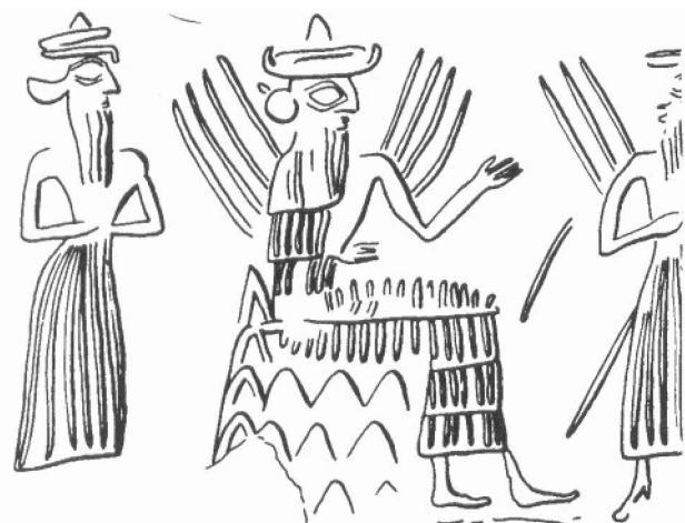
Schamasch, de zonnegod, zit als rechter op zijn troon, die gevormd wordt door bergen

In zijn bespreking van de bouwkunst van de Soemeriers schetst Horst Janson de vormgeving van hun steden met in het midden ervan op een platform de tempel van de plaatselijke god. Hij wijst op het effect van die tempels als oriëntatiepunten, als kunstmatige heuvels hoog oprijzend boven de monotone vlakte. Vervolgens bespreekt hij een tweetal voorbeelden: 'Van deze heuvels, ziggurats genaamd, was de bijbelse Toren van Babel de beroemdste' ( Wereldgeschiedenis van de kunst , blz. 71). Deze laatste is er niet meer, maar bij Warka (her Erek uit Gen. 10, 10) is een recenter exemplaar bewaard gebleven. Ook de onderste verdieping van de ziggurat te Ur (Gen. 11, 28)