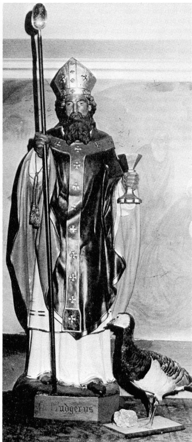
Neo-gotisch beeld van Liudger in de Rooms-katholieke kerk van Bolk (Fr.).

Ondanks deze vreselijke ervaring gaat de verkondiging korte tijd later weer door. De plaats waar Ronifatius vermoord werd, wordt een bedevaartsplaats waar men in een