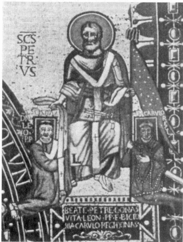
Petrus niet paus Leo III (links) en Karel de Grote (rechts). Het onderschrift: 'Zalige Petrus, gij schenkt het leven aan paus Leo en de overwinning aan koning Karel'. Mozaïek in het Lateranen-paleis te Rome.

Ook in de persoonlijke sfeer wist Liudger zijn zelfstandigheid als kerkelijk ambtsdrager met succes te verdedigen tegenover een keizer die hem begon te wantrouwen. Liudger – hij was toen al bisschop – moest zich namelijk eens verantwoorden tegenover de keizer. Toen Karel er een van z'n dienaren op uitstuurde om de bisschop te ha-