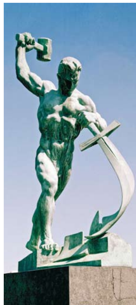
Zij zullen hun zwaarden omsmeden tot ploegijzers en hun speren tot snoeimessen (Jes. 2:4). (Beeldhouwwerk van Evgeniy Vuchetich in de United Nations Art Collection) ///

Dat horen we ook in Openbaring 6. Eerst is er nog vrede. Ook dat kennen we uit eigen ervaring. Er wordt weinig over geschreven: goed nieuws is geen nieuws. Laat je ogen eens door het panorama dwalen: een paar miljard mensen die ’s morgens opstaan; de zon gaat op, ze gaan aan het werk; ze gaan heerlijk schaatsen en zijn vervolgens blij als het na een paar maanden weer warmer wordt. Zo regeerde God: Hij was