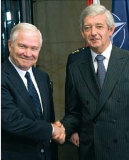
Verwelkoming van de Amerikaanse Secretary of Defence Robert Gates op de NAVO-Top in Noordwijk, oktober 2007 ///

niets dat we tientallen miljoenen euro's hebben uitgegeven voor de bestrijding van berrmbommen.'