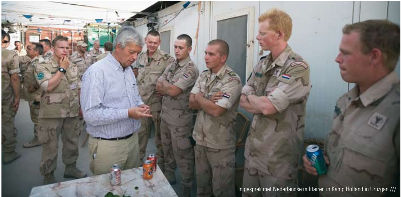
In gesprek met Nederlandse militairen in Kamp Holland in Uruzgan ///

voet gestaan. De bestendige lijn in de geschiedenis is dat christenen geen doctrinaire pacifist zijn. Helaas zie je soms dat het christendom ten onrechte verengd wordt tot het hart en de persoonlijke levenssfeer. Natuurlijk geldt ook voor mij onverkort dat je je linkerwang moet toekeren aan wie je op de rechterwang slaat. Maar de God van de Bergrede is ook de God die de overheid heeft ingesteld. Het leger is daarom geen noodzakelijk kwaad, maar een legitiem instrument. Voor de zingeving van de militair is dit cruciaal. Van Calvijn leerde ik dat de staat een genadegave van God is. Na de zondeval hoort daar de zwaarmacht bij. God kijkt niet de andere kant op als er geweld wordt gebruikt. Bavinck zei in 1914 al: “Er is een zondige vrede, omdat er machten zijn met wie wij nooit in vrede kunnen leven.” Natuurlijk besef ik dat dit onderwerp een zekere spanning oplevert. De Bergrede geeft het gewenste normale aan, terwijl men in de christelijke politiek te maken krijgt met het gebruik van geweld. Maar dit is